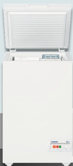
GT 1421 CHR